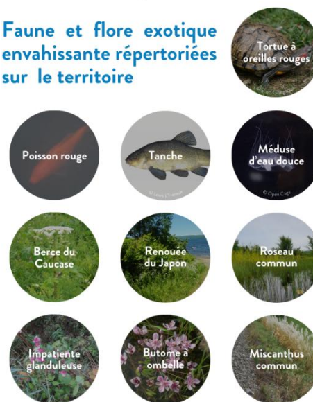
Figure 16 : Localisation des espèces exotiques envahissantes à l'intérieur et à proximité de la ZGIE